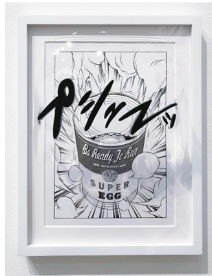
20 《MANGA -プシューツ-》

380×480×250mm シルクスクリーン, レジン, 木材, PET 2018