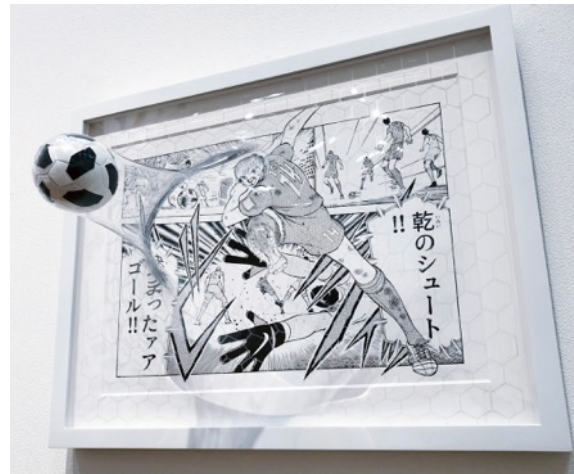
19 《MANGA -201873-》

身の回りにある日常的なものをモチーフとし、ありそうでありえない瞬間を捉えた立体作品を制作、発表。PET素材を駆使し、“日常のなかでよく目にするものに命を吹き込んだらどんな動きをするか”をコンセプトにしている。韓国のトップデザイナーのイ・サンボン氏と2011年にパリコレでコラボレーションするなど、日本にとどまらず韓国や香港、欧米など国内外のアートフェアや展覧会に多数参加。